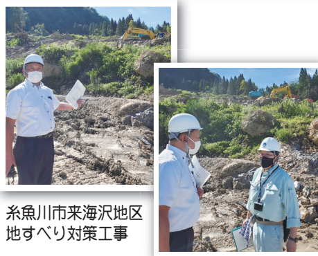
糸魚川市来海沢地区 地すべり対策工事