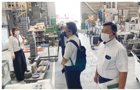
能作 錫製品ブランド戦略