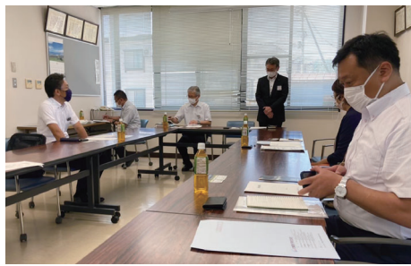
未来にいがた会派視察(北越急行株)