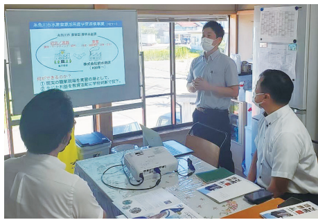
海洋高校アンテナショップの取組