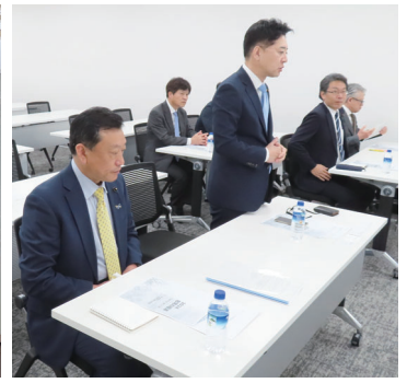
会派台湾視察 （日本台湾交流協会）