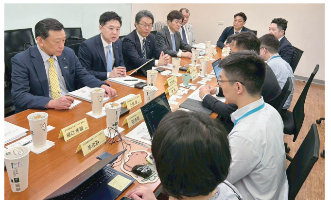
会派台湾視察（台湾經濟部台日連携推進オフィス）