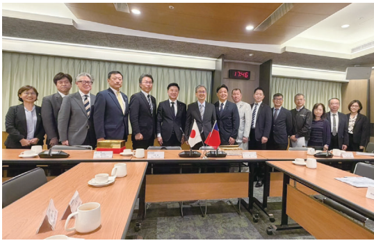
会派台湾視察（台湾電力公司）