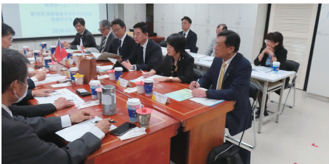
会派台湾視察（台湾經濟部エネルギー局）