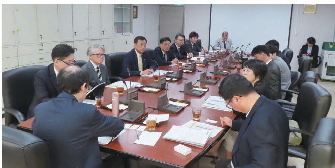
会派台湾視察（核能安全委員会）

答弁 [知事] 防止に向けた条例の制定について、今年度の県に寄せられたカスハラ関連の相談件数は1月末までで10件となっているが、潜在的な被害も想定されることから、状況を注視していく必要があると考えている。昨年6月に成立した事業者へのカスハラ防止措置を義務付けた改正法に基づき、具体的な措置内容を示す指針が、示された。県としては、まずは国の指針を踏まえ、事業者への周知啓発を着実に進めるとともに、先行自治体の動向も参考に、カスハラ防止に向けた条例制定の必要性を含め、研究したいと考えている。