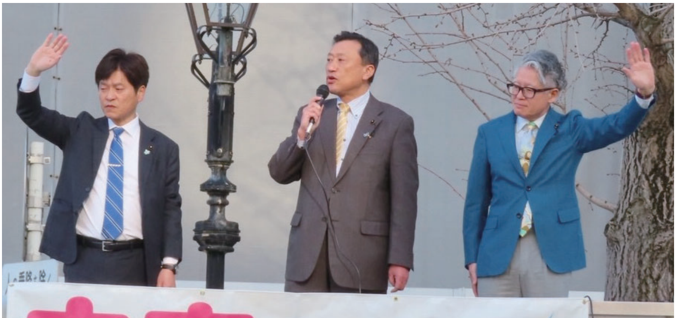
会派街頭県政報告