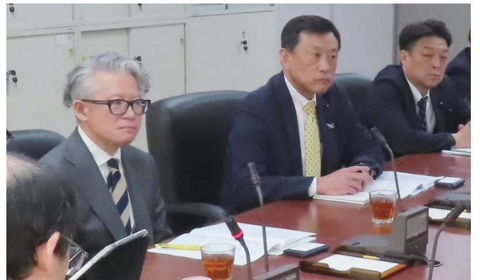
会派台湾視察（台湾經濟部エネルギー局）