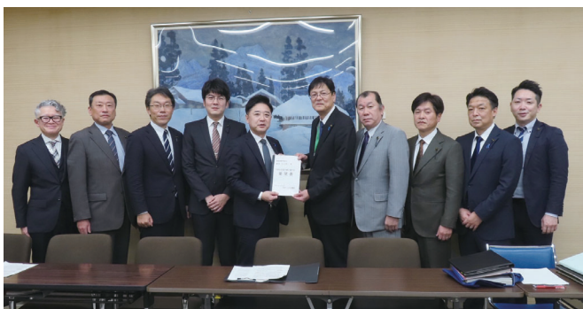
会派令和8年県予算要望

答弁 〔知事〕中部電力浜岡原発における不正問題は、原発の審査において、不正はあってはならないと考えている。今般の不正問題については、現在、原子力規制委員会が事実関係や原因等の調査を行っているところであり、県としては、その対応を注視していく。